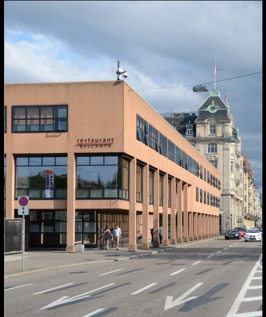
Esplanade / Belcanto Opernhausnebengebäude: Kern einer Auskernung