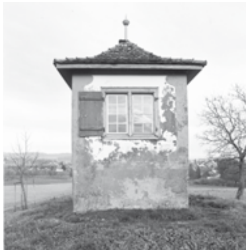
Links: Ansicht der schadhaften Westfassade vor der Restaurierung. Zustand November 2002. Rechts: Ansicht von Südwesten während der Restaurierung. Zustand Mai 2004.