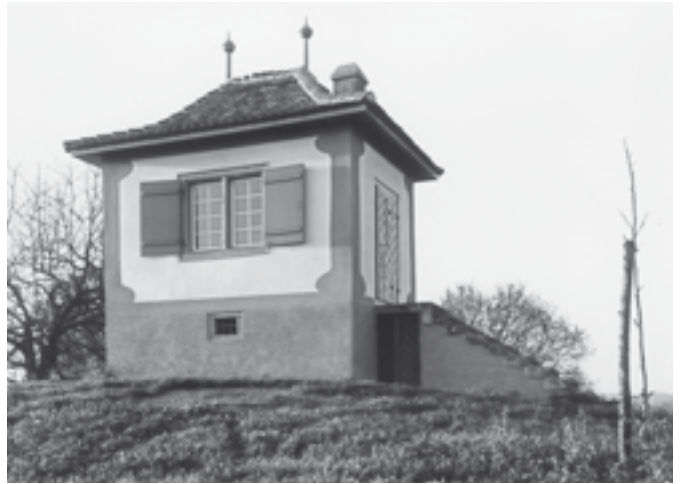
Oben links: Ansicht von Südwesten. Zustand Mai 1963. Oben rechts: Ansicht von Süden. Zustand Oktober 1965. KDP Fotoarchiv.

Der Spengler erneuerte die Dachrinnen und reparierte die goldenen Kugeln der Turmspitzen, der Dachdecker tauschte defekte Ziegel aus. Die Podestplatte und die unterste Blockstufe der auf der Ostseite hinaufführenden Treppe ersetzte man. Die Massnahmen im Innern des Rebhäuschens umfassten einen Neuanstrich der Wände, die Reinigung des Kamins und den Ersatz beschädigter Tonplatten. Die Risse der Stuckdecke wurden gestopft und fehlende Teile der profilierten Leisten mittels einer alten Schablone rekonstruiert.