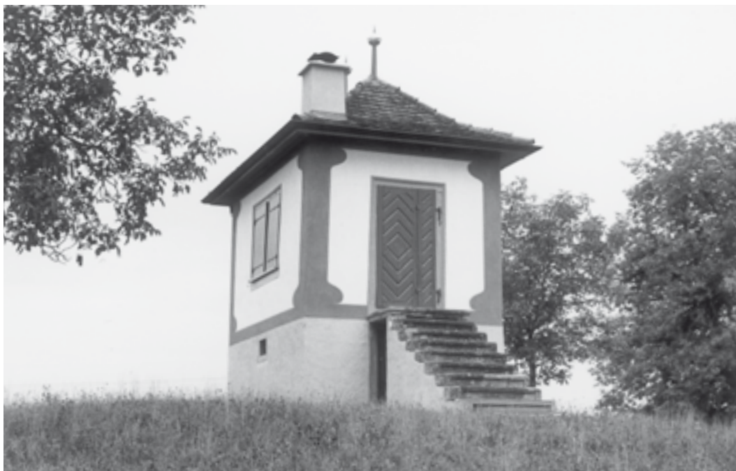
Ansicht von Osten. Zustand nach der Restaurierung, August 2006.