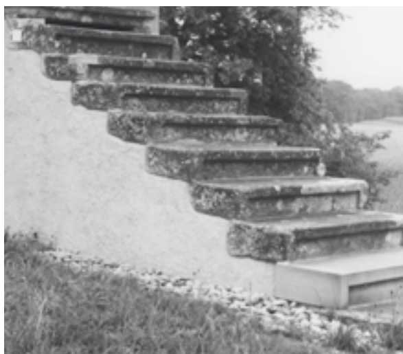
Links: Teilansicht einer Ecklisene vor der Restaurierung. Zustand Juli 2004. Rechts: Teilansicht der Freitreppe mit gemauertem Unterbau und Sandstein-Stufen. Zustand nach der Restaurierung, August 2006.